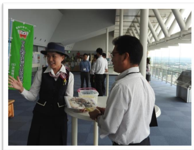
一般来場者へバスの日のご案内を致しました。