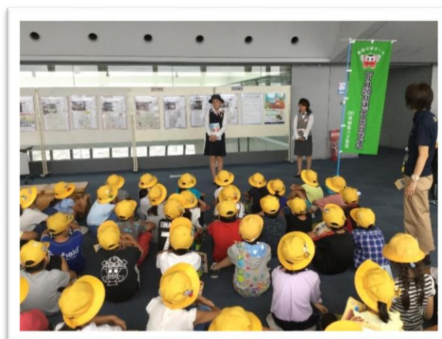
県庁の見学に訪れた小学生200名に対しバスの日の由来を説明致しました。